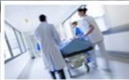
Nemocniční informační systémy POWERNIS/SSB