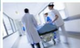
Nemocniční informační systémy POWERNIS/SSB