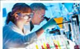
Laboratorní informační systémy POWERLIS/SSB