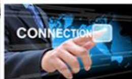
Informační systémy na míru