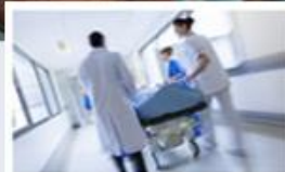
Nemocniční informační systémy POWERNIS/SSB