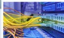
Systémy pro správu budov POWERBM/SSB