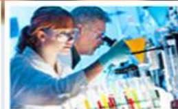
Laboratorní informační systémy POWERLIS/SSB