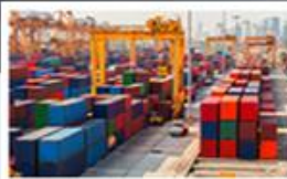
Automatizace a robotizace v oblasti logistiky