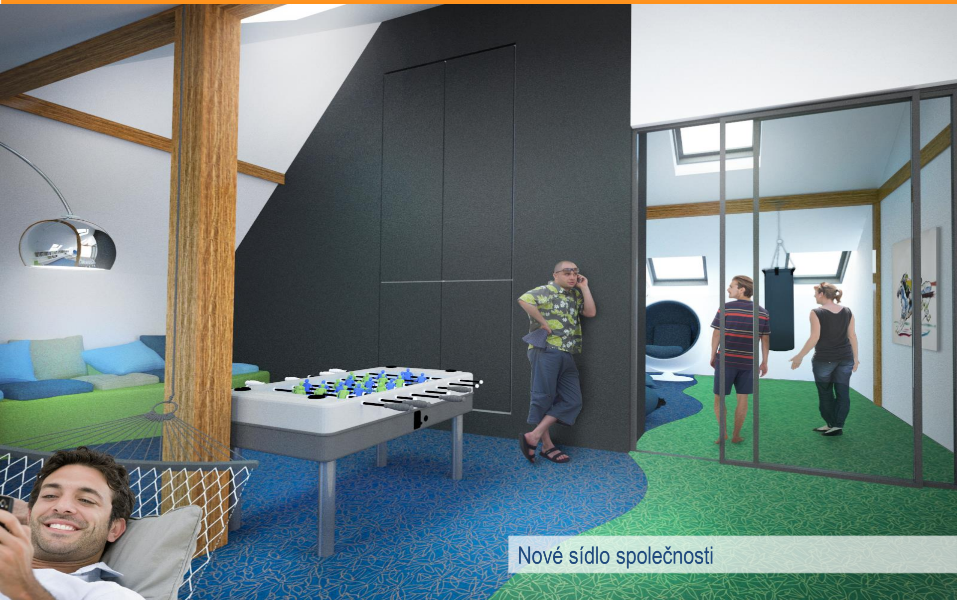
Nové sídlo společnosti