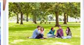
Systémy pro řízení a podporu projektů POWERVP/SSB