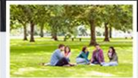
Systémy pro řízení a podporu projektů POWERVP/SSB