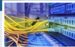
Systémy pro správu budov POWERBM/SSB