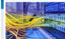
Systémy pro správu budov POWERBM/SSB