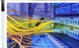
Systémy pro správu budov POWERBM/SSB