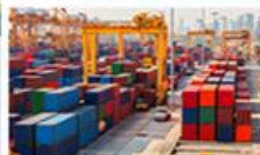
Automatizace a robotizace v oblasti logistiky