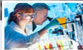
Laboratorní informační systémy POWERLIS/SSB