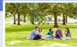
Systémy pro řízení a podporu projektů POWERVP/SSB