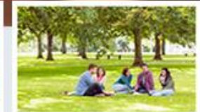
Systémy pro řízení a podporu projektů POWERVP/SSB