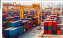
Automatizace a robotizace v oblasti logistiky