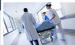
Nemocniční informační systémy POWERNIS/SSB