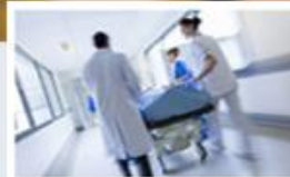
Nemocniční informační systémy POWERNIS/SSB