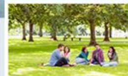
Systémy pro řízení a podporu projektů POWERVP/SSB