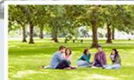
Systémy pro řízení a podporu projektů POWERVP/SSB