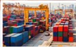
Automatizace a robotizace v oblasti logistiky