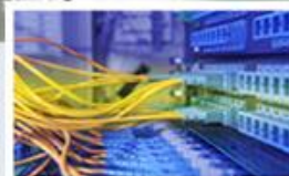
Systémy pro správu budov POWERBM/SSB