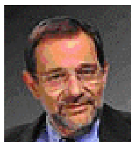
Vysoký zmocněnec pro SZBP Javier Solana

Do této funkce byl v červnu 1999 jmenován španělský politik Javier Solana Madariaga (ujal se úřadu v říjnu 1999).