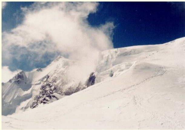
Vrcholová část kopce

A valíme dolů. 900 m na Payer hütte a pak 1400 m dolů do údolí a ještě posledních 400 m nahoru na naše tábořiště. Hurá, jsme doma. Najíst, vyčurat a spát.