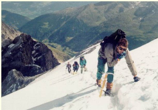
Žízeň, Pítrs žere sníh

Původní plán vstát v 7 nebo v 8 se nevydařil. Nejdřív nás v půl páté vzbudil bratr, který se šel vyčůrat. Pak začali venku hulákat Maďaři. A v 6 už bylo ve spacáku tak zima, že jsem musel vstát. A když už jsem vzhůru já, tak proč ne všichni?