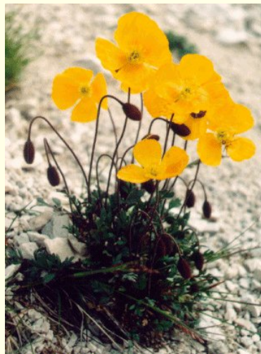
Dolomitské vlčí máky

Z kopce vede cesta dolů tunelem. Škoda, že nemáme baterky. No, aspoň to bylo romantické.