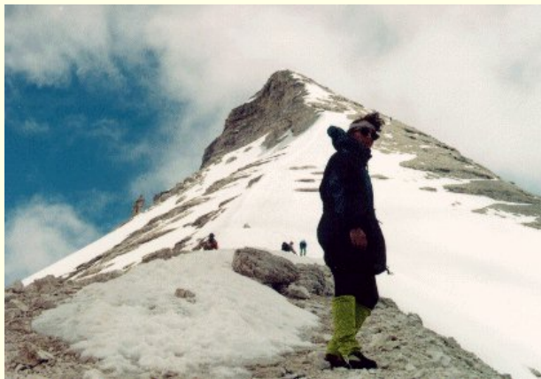
Vrcholový hřebínek Tofany