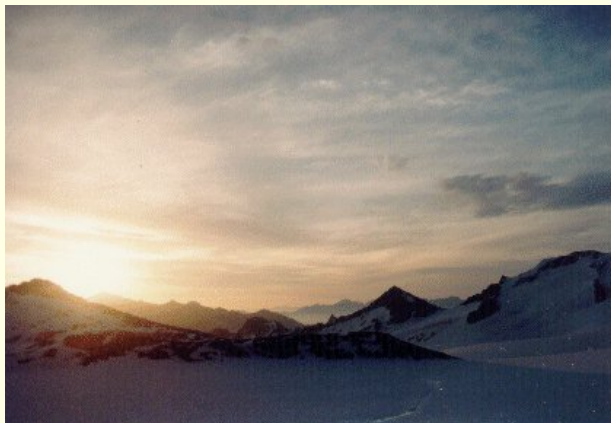
Východ slunce nad ledovcem

Už brzy ráno začal bratr hulákat, že prý je venku pěkně. Nu což, vstaneme. A ono opravdu, venku je docela hezky. Od hrany hřebene sice občas vylétají mraky, ale nad celou obrovskou plochou ledovce je jasno. Snídáme a vyrážíme na vrchol (3554 m).