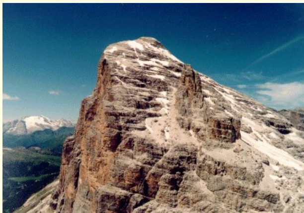
Tofana di Rozes

Tento den se nám hezky vydařil. Vybatolili jsme se do aprílového rána. Na obloze se honily mráčky různých odstínů a nacucanosti a počasí ne a ne se rozhodnout, jaký bude den. A nakonec bylo hezky.