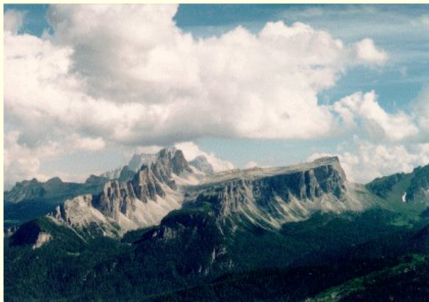
Croda di Lago

Budíček dnes obstarali karabiníci, kteří nás slušně, ale neúprosně vyhánějí ven ze stanů. Po snídani odjíždíme pod náhorní planinu Croda di Lago, která je naším dnešním cílem.