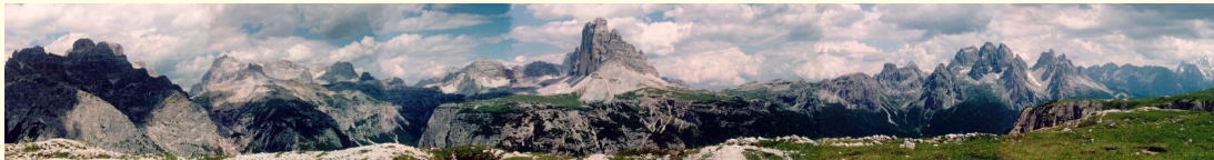
Výhled z Mt. Piana

Po vydatné snídani vyrážíme (jen k autu). Po dlouhém a dlouhém přebalování vyrážíme do terénu. Nejvíc se všem líbila „cesta kastrátů“ (kluci nahoře byli jako vyměnění). Monte Piano 2300 m bylo piánko na rozehřátí. Ovšem ten výhled! Paráda!