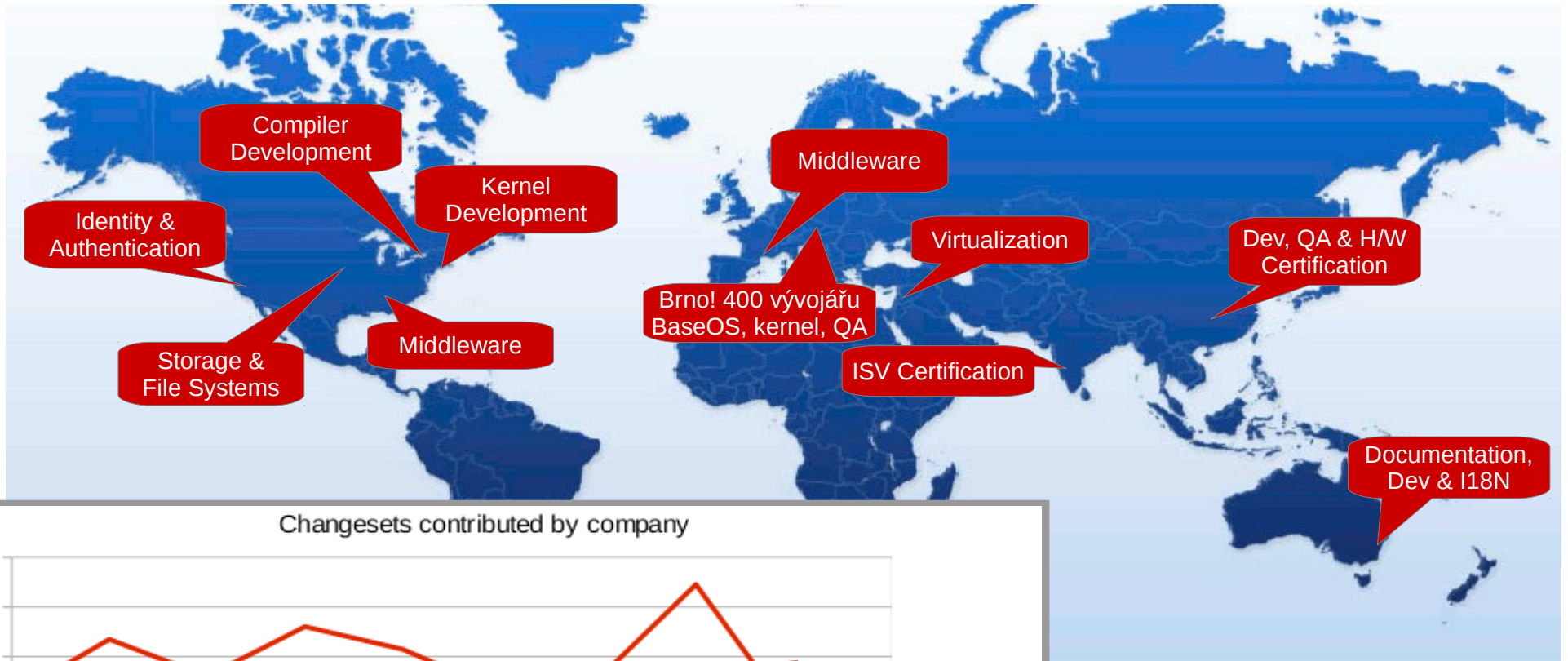
Changesets contributed by company